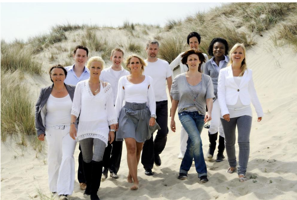
Het Dutchen team